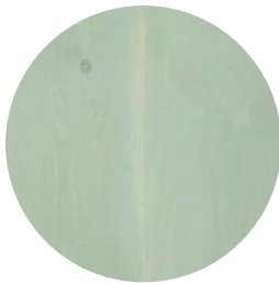
SALT LAKE GREEN