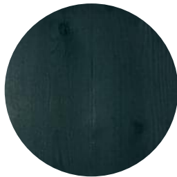
RUBIO MONOCOAT GREEN