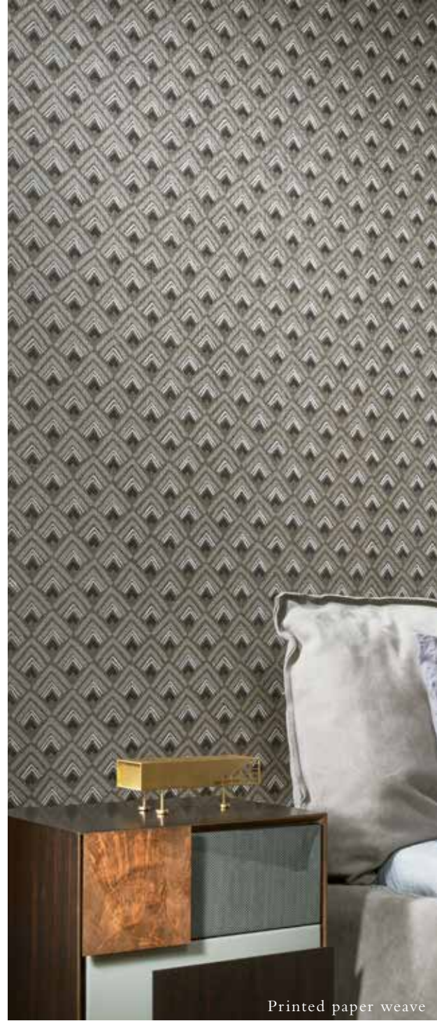
Printed paper weave