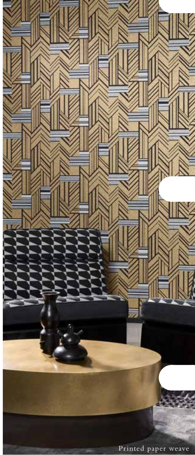
Printed paper weave