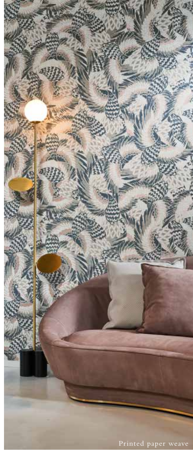
Printed paper weave