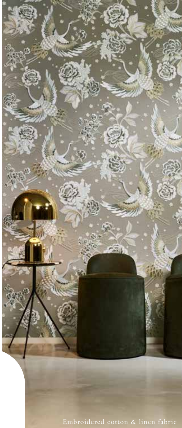
Embroidered cotton & linen fabric